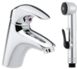
Damixa Space WT-Hebelmischer mit Handbrause und Schlauch