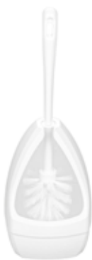
WC-Garnitur Pyramidenform weiß