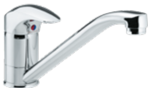
Damixa Space Spültischarmatur, Einhebelmischer Niederdruck